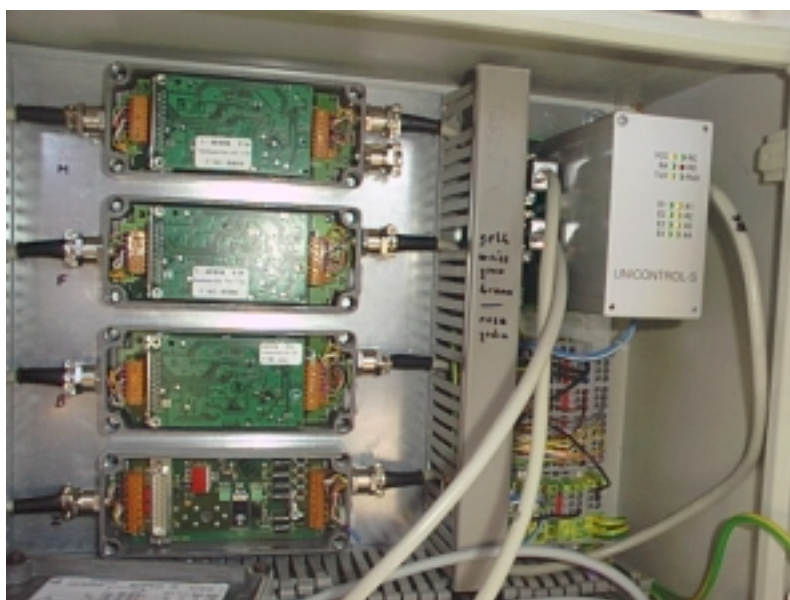
Sklopovi A/D vage